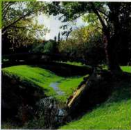
Après le bronze, le label argent pour le golf de Vauzouffres, près de Niort.