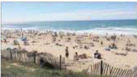
Le mois d'août a sauvé la saison touristique.

TOURISME. Le mauvais temps a eu un impact sur la fréquentation touristique en Médoc, mais le mois d'août a permis de limiter la casse dans la destination, selon l'office de tourisme Médoc Atlantique.