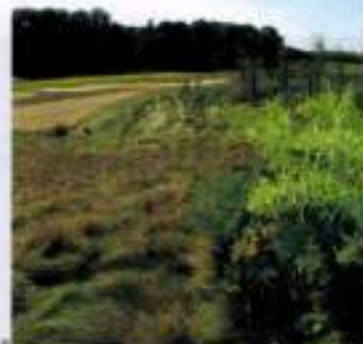
Exemple de prairie au golf de Ménilles, dans les Hautes-de-France.