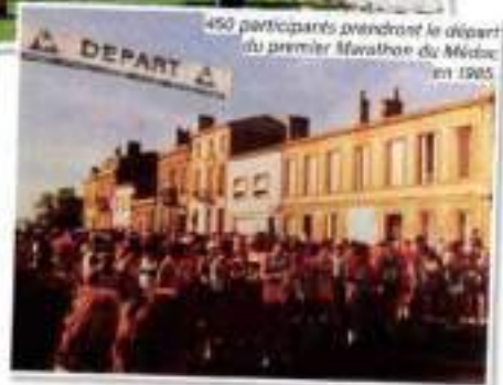
450 participants prendront le départ du premier Marathon du Médoc en 1985