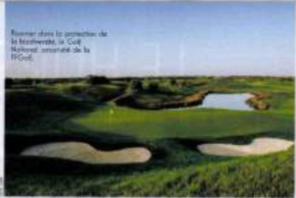
Flourier dans la protection de la biodiversité, le Golf National soutient de la FFGolf.