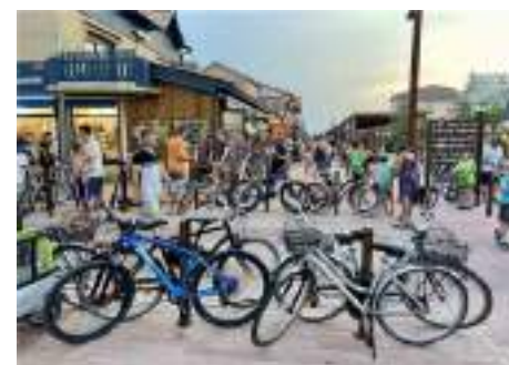
Cet été, l'Office de tourisme Médoc Atlantique a mesuré un bon niveau de fréquentation sur le littoral. L'Office de tourisme Médoc Atlantique a réuni ses partenaires dans les locaux du Vitalparc de Lacanau . J. L. P. M.

« La saison touristique a été en dent de scie, avec une météo peu favorable en juillet »