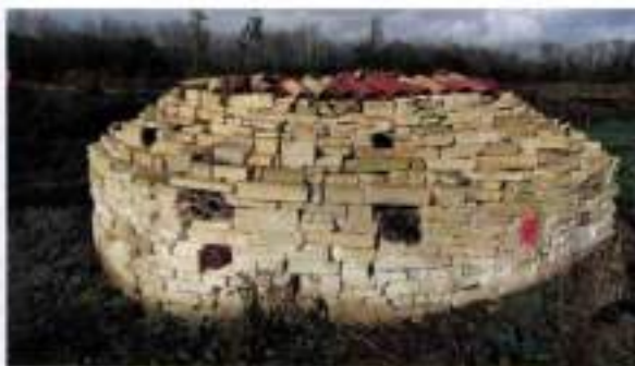
Bel exemple de réseau en pierres sèches au golf de La Rochelle Sud.

● Aujourd'hui 206 golfs français, soit plus de 30% des golfs de France et plus, sont inscrits dans le programme de labellisation, dont 110 golfs sont d'ores et déjà titulaires de l'un des labels bronze, argent ou or. 63 golfs possèdent le niveau bronze, 45 le niveau argent et 2 le niveau or, et 4 autres sont actuellement en cours de validation du plus haut niveau en matière de biodiversité. Voici une liste région par région pour repérer les golfs déjà labellisés avec leur niveau ou celui qu'ils cherchent à obtenir. (* Les golfs en cours de labellisation.)