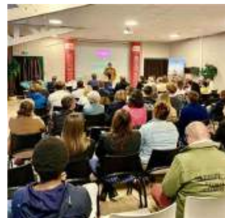
Cet été, l'Office de tourisme Médoc