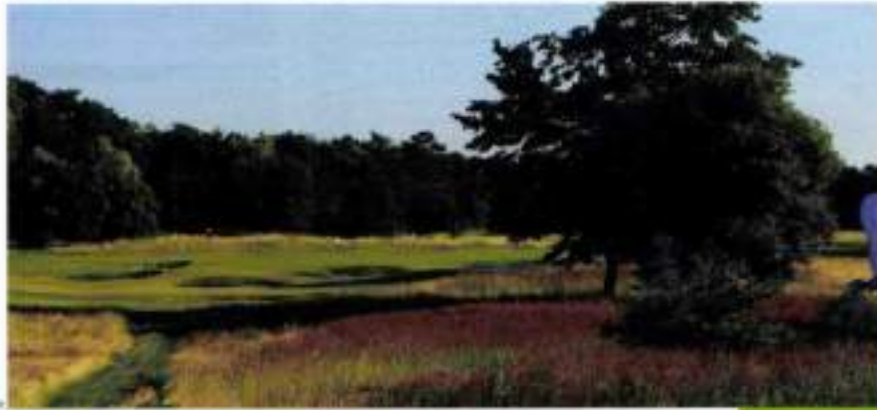
Plus de 20 espèces d'oiseaux ont été recensées au golf de Charentilly en moins de deux semaines.

clubs de vie privilégiés, au des parcours de biodiversité au sein de nos parcours. Nous avons pu bénéficier financièrement de financements sur les espèces végétales et animales dans nos golfs qui servent d'habitats d'oiseaux, notamment du patrimoine naturel. Nous avons en effet obtenu sur nos parcours d'espèces végétales et animales, notamment au sein de la Maison Botanique d'histoire naturelle. Les échanges d'expertise qui ont pu être réalisés avec d'autres fédérations de golf européennes, dans le cadre d'une convention avec le Royal & Ancient, sont aussi une source de fierté. Cela a été débattu sur un séminaire européen qui nous a été sur deux jours au Golf National et au golf de Saint-Cloud avec une expertise de biodiversité de golf européenne. Nous avons pu partager nos pratiques et nos enseignements avec les autres pays européens sur le sujet des bonnes pratiques et des manuels à prendre pour préserver la biodiversité dans nos clubs, qui sont devenus des véritables refuges à Charentilly et cette biodiversité est présente notamment sur nos parcours en Europe et dans le monde. En l'absence d'une réglementation, nous avons pu plus de 50% des espèces à travers le monde.